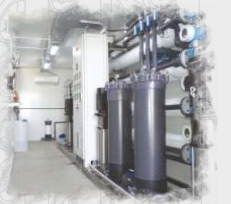
Konteyner Tipi Su Arıtma Sistemleri Container Type Water Treatment Systems Системы очистки воды контейнерного типа