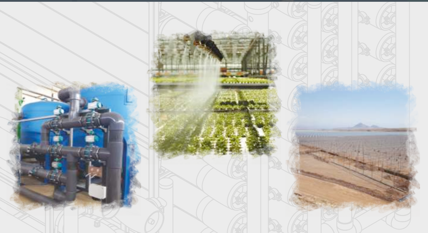
Topraksız Sera Sistemleri Hydroponics Greenhouse Systems Гидропоника в Тепличных Системах