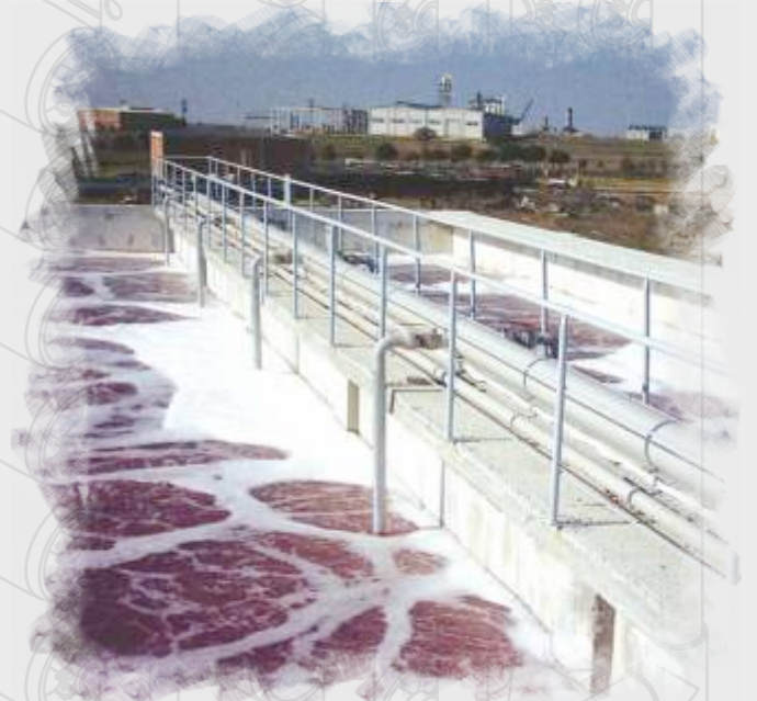
Enerji Santralleri Power Plants Электростанции