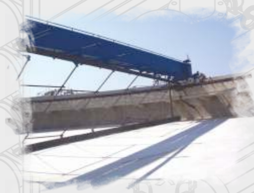
Atık Su Arıtma ve Geri Kazanım Sistemleri Waste Water Treatment and Recovery Systems Системы очистки и восстановления сточных вод