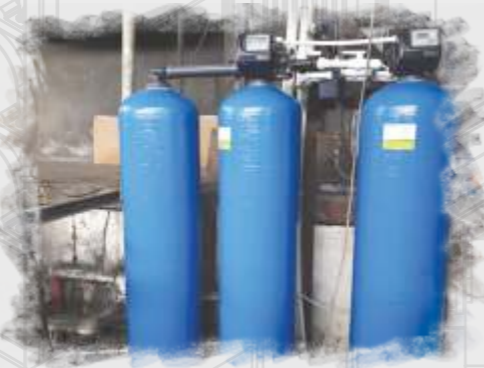
Filtrasyon Sistemleri Filtration Systems Системы фильтрации