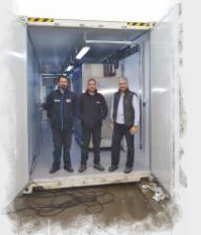
Medikal Su Arıtma Sistemleri Medical Water Treatment Systems Медицинские системы очистки воды