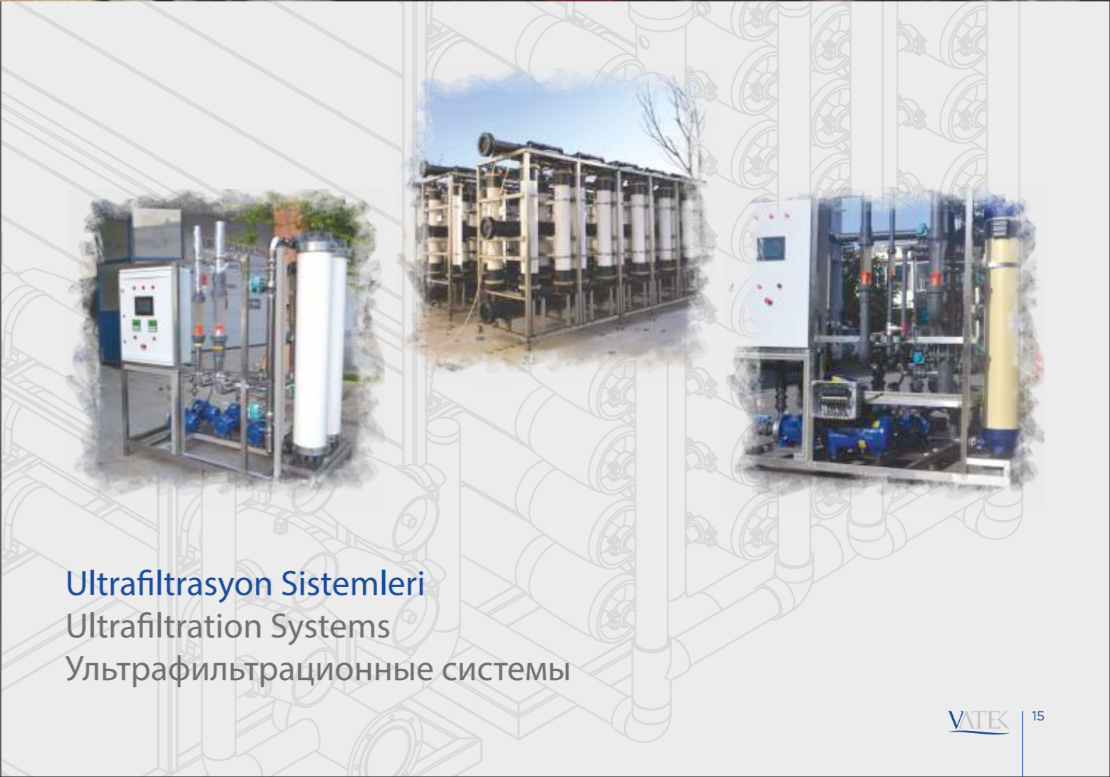
Ultrafiltrasyon Sistemleri Ultrafiltration Systems Ультрафилтрационные системы