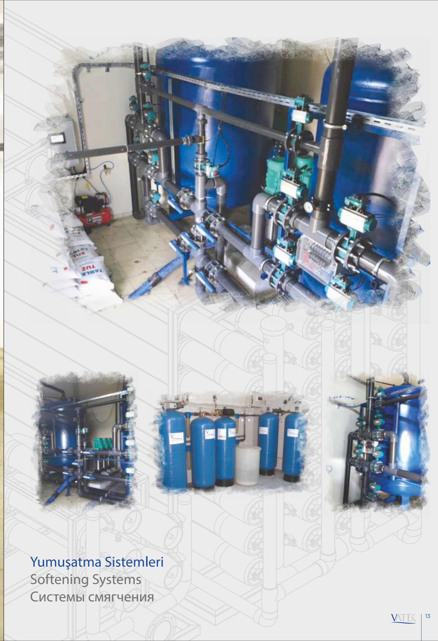
Yumuşatma Sistemleri Softening Systems Системы смягчения