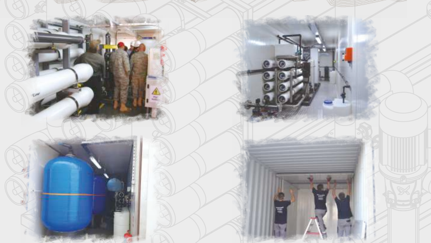
Askeri Kamplar için Özel Sistemler Special Systems for Military Camps Специальные системы для военных лагерей