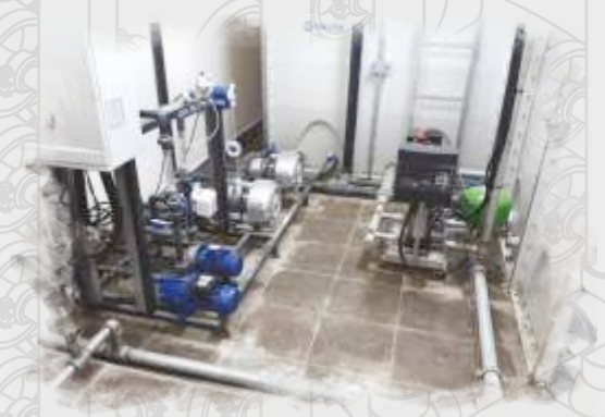
Gri Su ve Yağmur Suyu Arıtma Sistemleri Gray Water and Rain Water Treatment Systems Системы очистки серой и дождевой воды