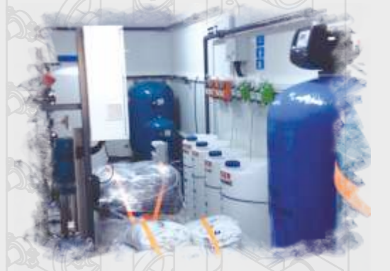
Mülteci Kampları için Özel Sistemler Special Systems for Refugee Camps Специальные системы для лагерей беженцев