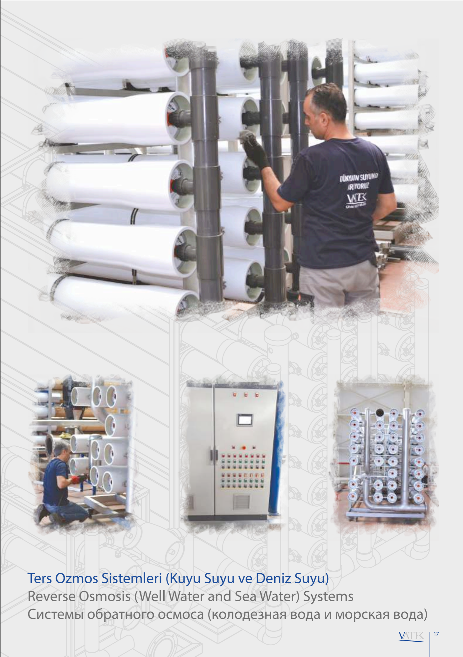
Ters Ozmos Sistemleri (Kuyu Suyu ve Deniz Suyu) Reverse Osmosis (Well Water and Sea Water) Systems Системы обратного осмоса (колодезная вода и морская вода)