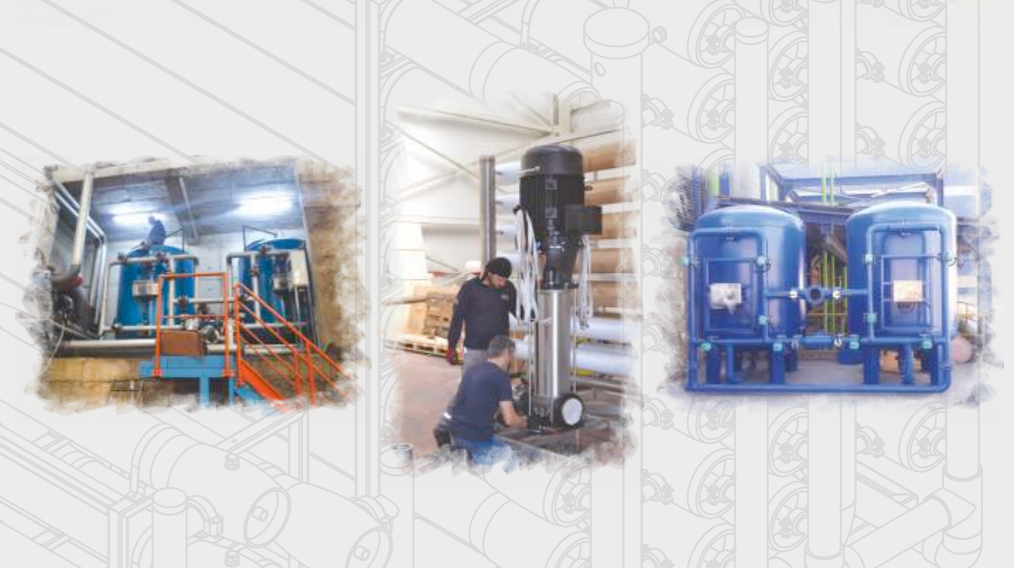
Şişeleme ve İçecek Sistemleri Bottling and Beverage Facilities Оборудование для объектов розлива и напитков