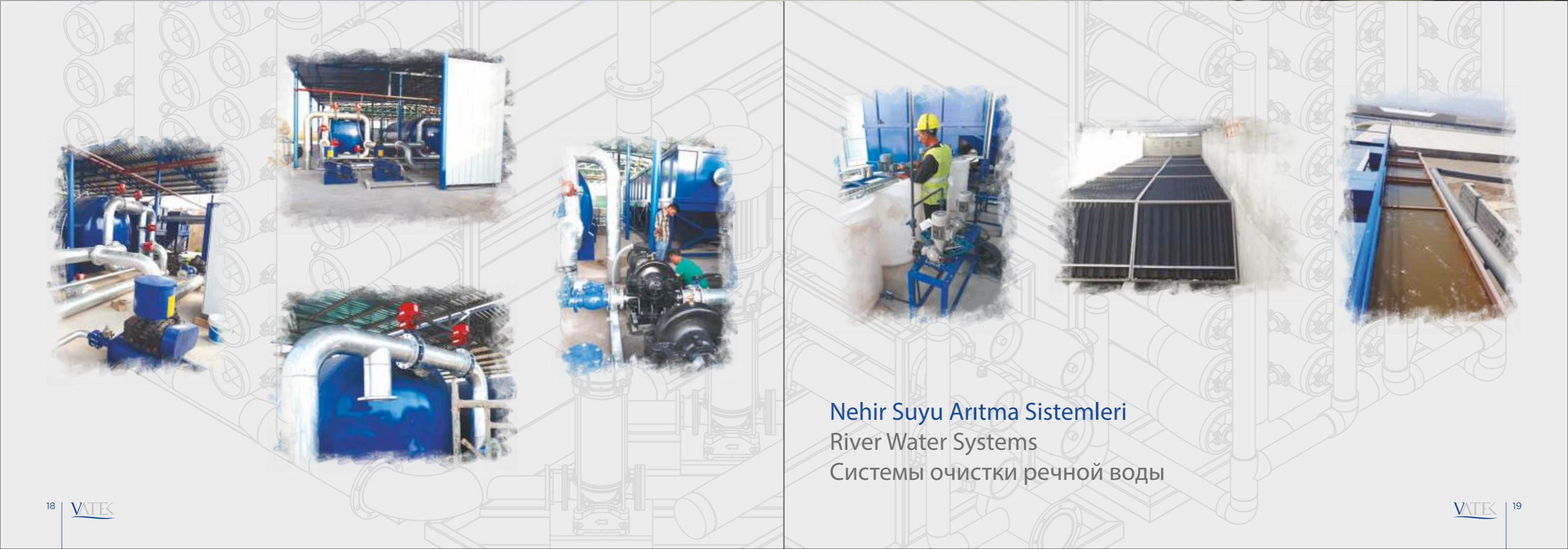
Nehir Suyu Arıtma Sistemleri River Water Systems Системы очистки речной воды